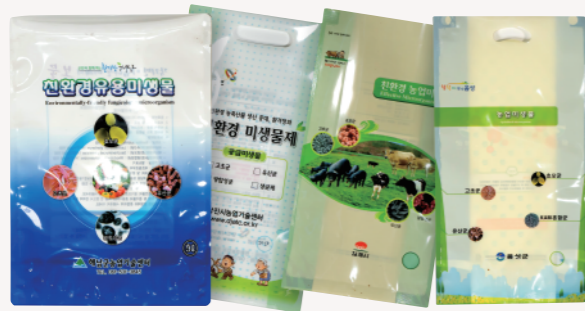
스탠딩 및 엠방 파우치 (2L-5L용)