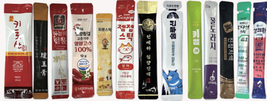
스틱, 액상, 분말

기술 혁신을 바탕으로 작은 일에도 소홀함 없이 정성을 다하여 식품 자동포장기계 제품을 공급하여 신속한 대응으로 고객 만족을 최우선으로 합니다.