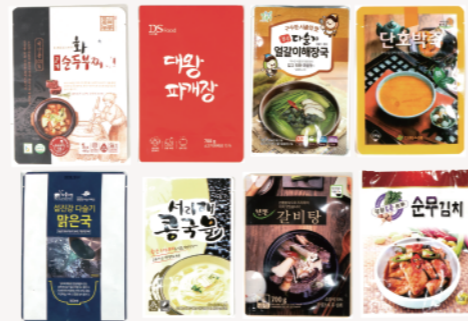
스탠딩 및 삼방 파우치