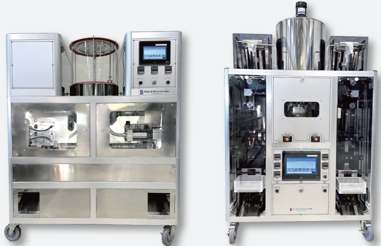
2열 스탠딩 삼방 복합기계